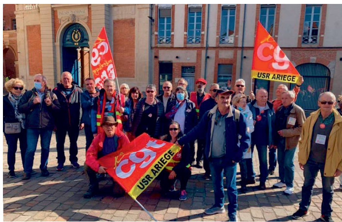
Les retraités exigent des pensions dignes lors du rassemblement régional à Toulouse le 24 mars

La CE de l'UD a pris toute sa part dans la mobilisation des syndicats. Un plan de travail précis a été élaboré, en lien avec les UL. Les camarades de la CE, à l'aide d'une